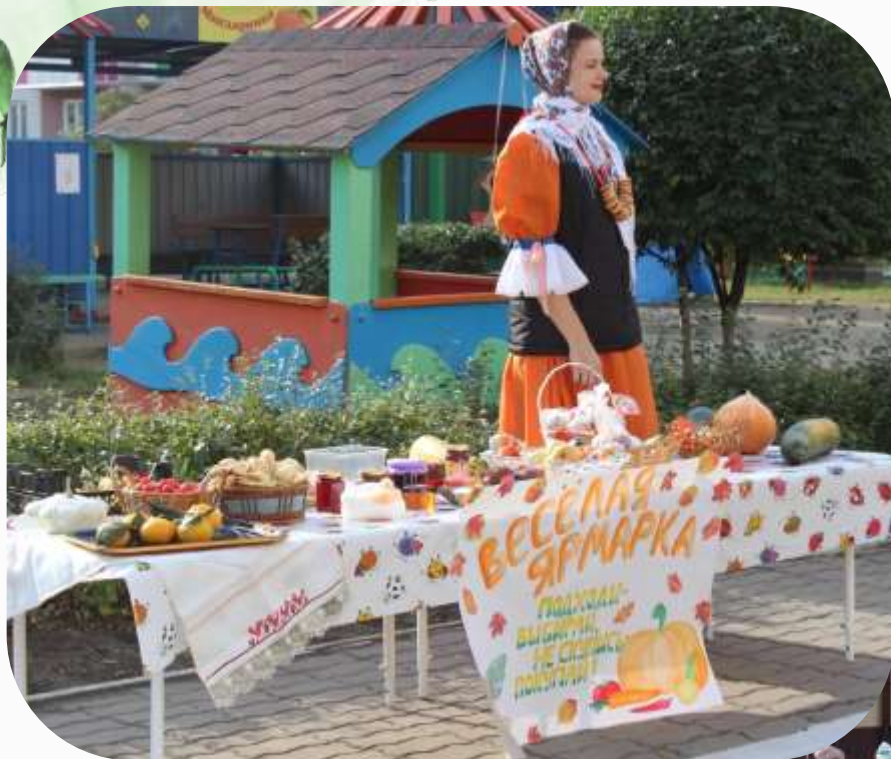
Осенняя ярмарка (выставка из овощей и фруктов)