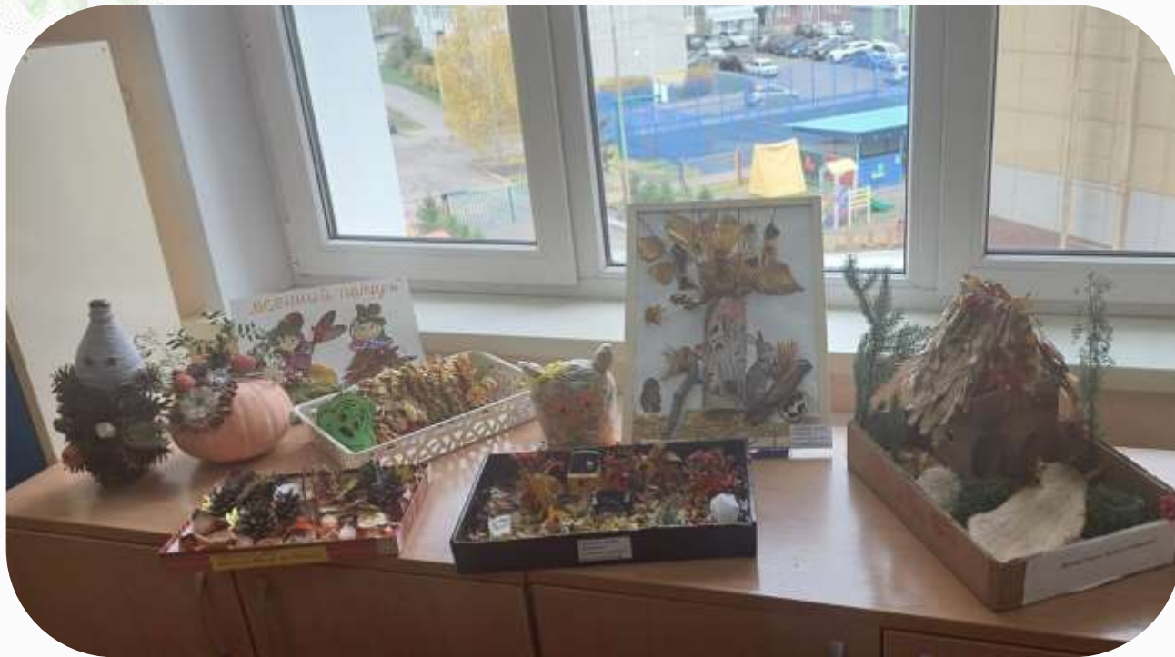
Выставка «Осенний калейдоскоп». Изготовление поделок из природного материала