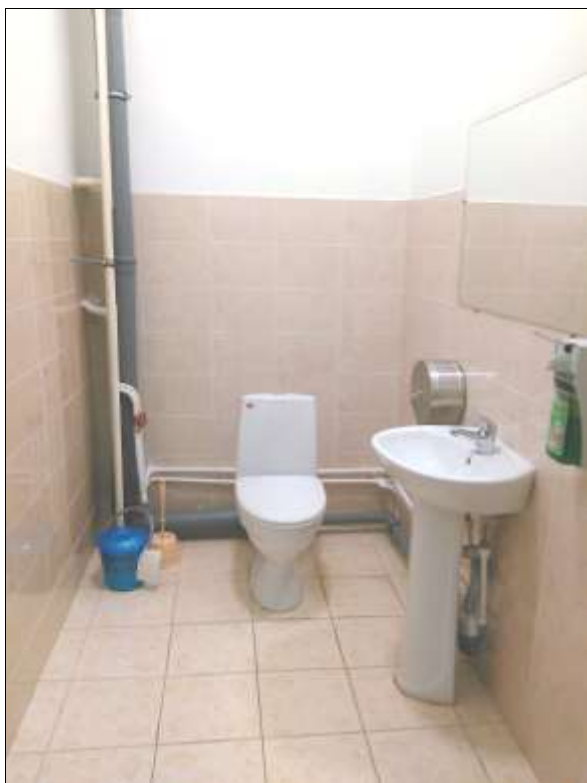
Фото № 16. Туалетная комната.