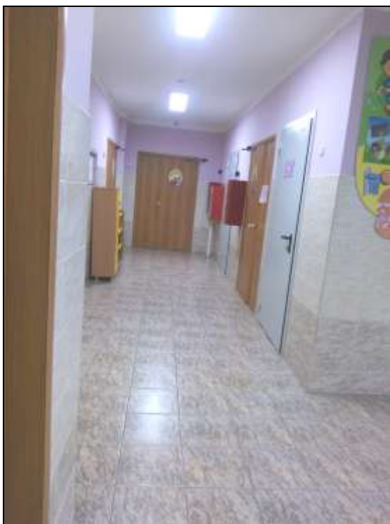
Фото № 11 Коридор (2 этаж)