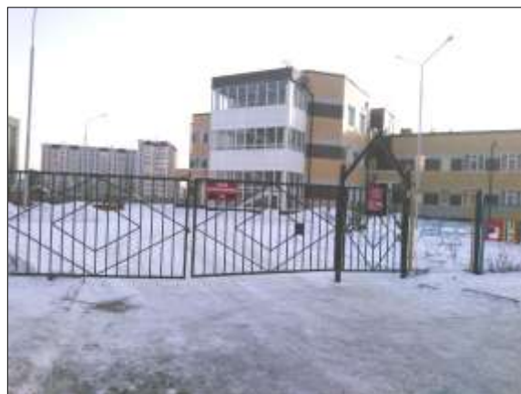
Фото № 2 Калитка и ворота № 2