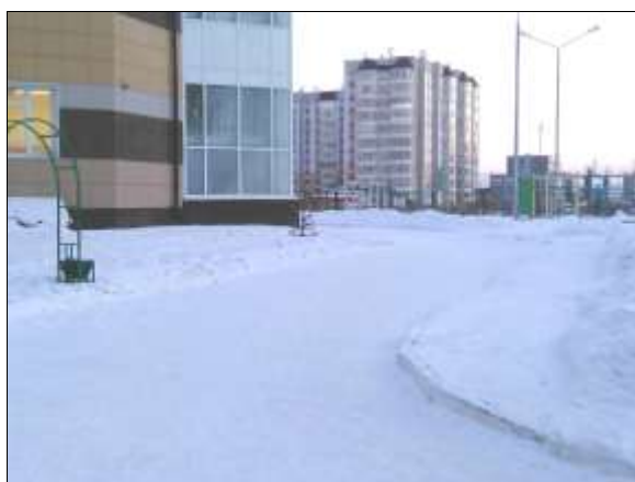
Фото № 3.