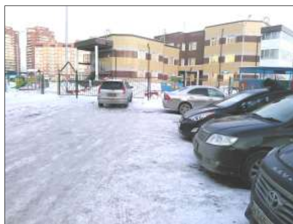
Фото № 6. Парковка.