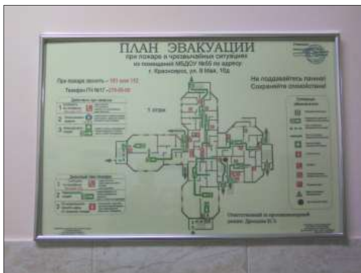
Фото № 18