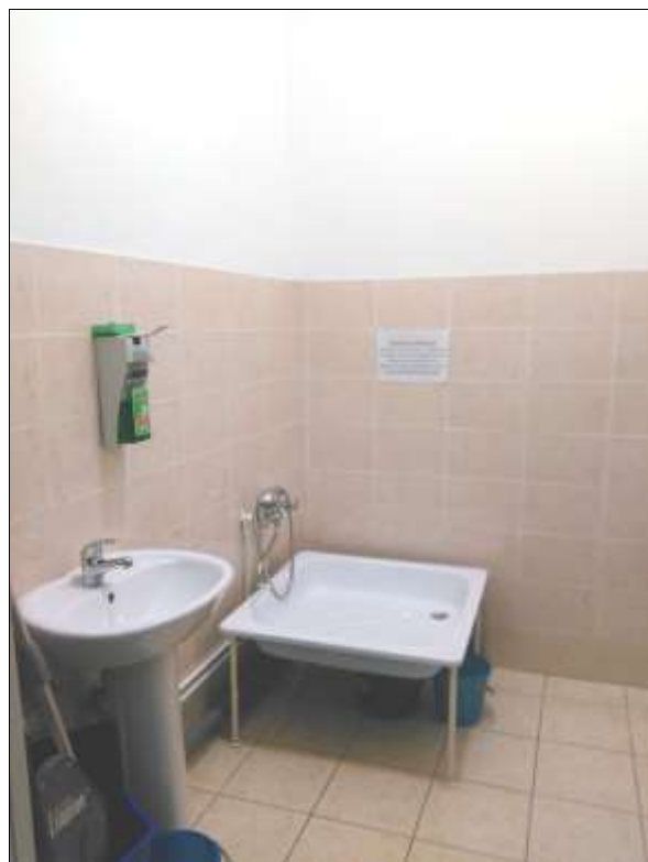
Фото № 17. Душ.