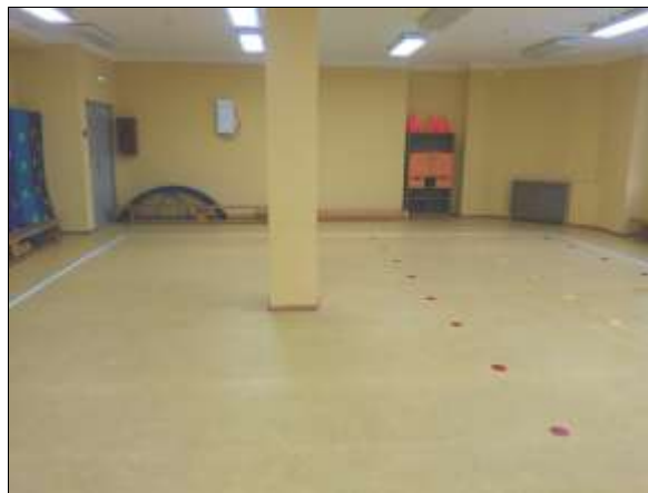
Фото № 15