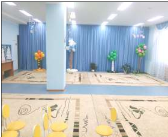
Фото № 14