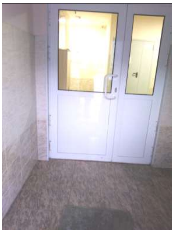
Фото № 8. Тамбур.