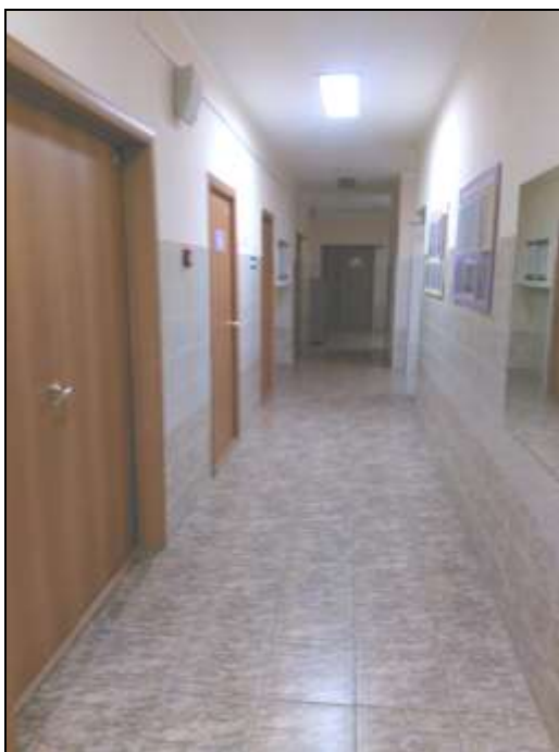
Фото № 9. Коридор (1 этаж)