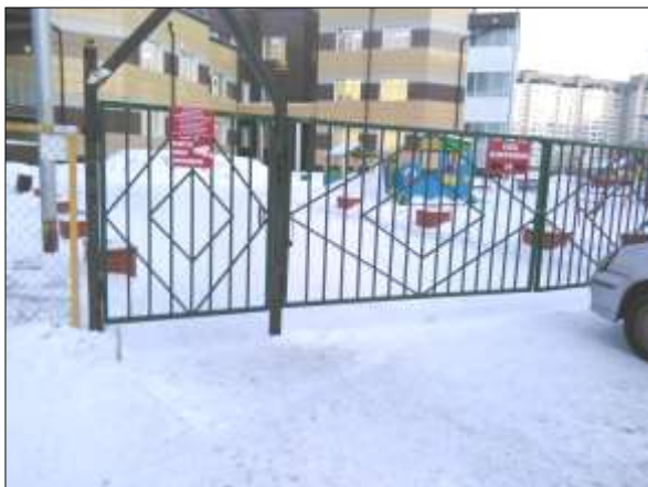
Фото № 1. Калитка и ворота № 1