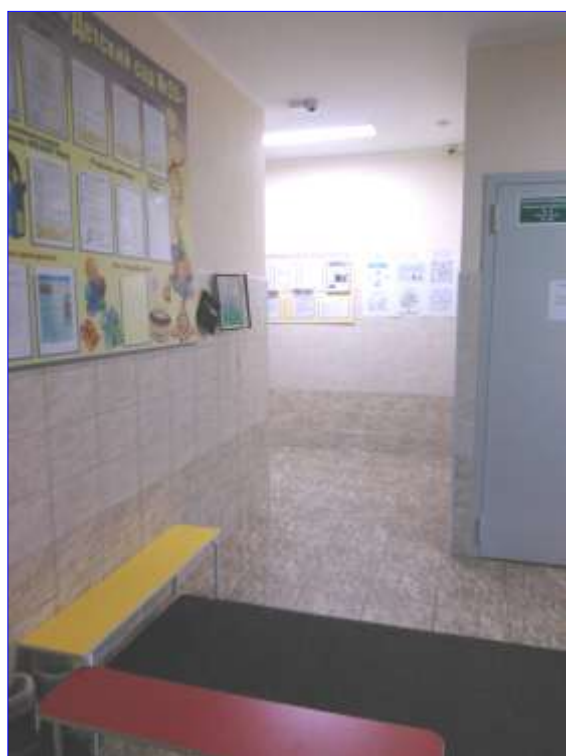
Фото № 19